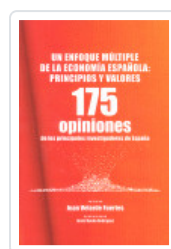
UN ENFOQUE MULTIPLE ECONOMIA ESPAÑOLA VELARDE, JUAN