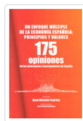
UN ENFOQUE MULTIPLE ECONOMIA ESPAÑOLA VELARDE, JUAN