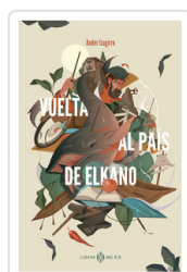
VUELTA AL PAIS DE ELKANO IZAGIRRE, ANDER