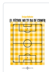
FUTBOL NO TE DA DE COMER, EL BALLESTER, ENRIQUE