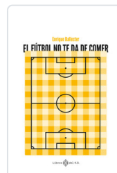
FUTBOL NO TE DA DE COMER, EL BALLESTER, ENRIQUE