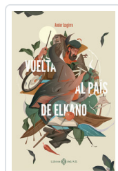
VUELTA AL PAIS DE ELKANO IZAGIRRE, ANDER