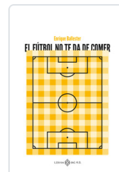
FUTBOL NO TE DA DE COMER, EL BALLESTER, ENRIQUE