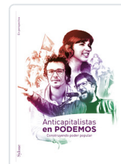
ANTICAPITALISTAS EN PODEMOS AA.VV