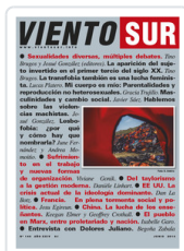
REV. VIENTO SUR, 146 AA.VV