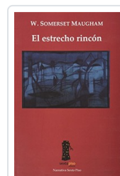
ESTRECHO RINCON MAUGHAM, SOMERSET