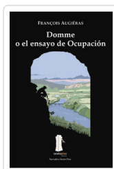
DOMME O EL ENSAYO OCUPACION AUGIERAS, FRANCOIS