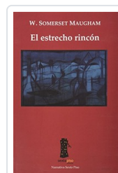
ESTRECHO RINCON MAUGHAM, SOMERSET