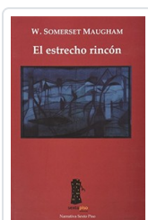
ESTRECHO RINCON MAUGHAM, SOMERSET