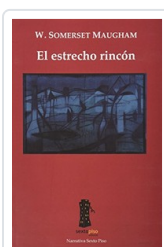
ESTRECHO RINCON MAUGHAM, SOMERSET