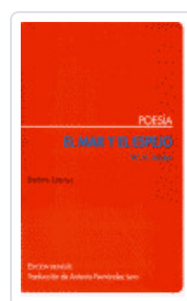
MAR Y EL ESPEJO AUDEN, W.H.