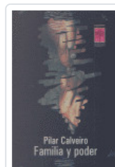
FAMILIA Y PODER CALVEIRO, PILAR