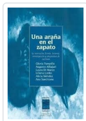
UNA ARAÑA EN EL ZAPATO AA.VV