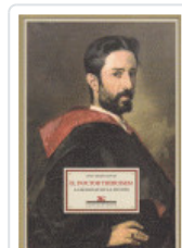
DOCTOR THEMBUSSEM YBARRA, INOGO