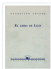
LIBRO DE LILIT GRANDE, GUADALUPE