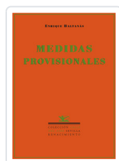
MEDIDAS PROVISIONALES BALTANAS, ENRIQUE