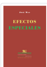
EFECTOS ESPECIALES MAS, JOSE