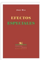
EFECTOS ESPECIALES MAS, JOSE