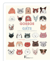
GOSSOS I GATS SOTA LA LUPA DELS CIENTIFICS FISCHETTI, ANTONIO