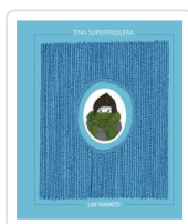
TINA SUPERFRIOLERA YAMAMOTO, LANI