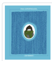
TINA SUPERFRIOLERA YAMAMOTO, LANI