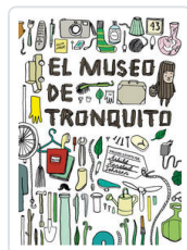
MUSEO DE TRONQUITO, EL KANSTAD, ASHILD