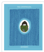
TINA SUPERFRIOLERA YAMAMOTO, LANI