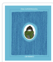
TINA SUPERFRIOLERA YAMAMOTO, LANI