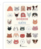
GOSSOS I GATS SOTA LA LUPA DELS CIENTIFICOS FISCHETTI, ANTONIO