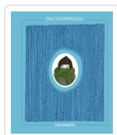
TINA SUPERFRIOLERA YAMAMOTO, LANI