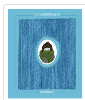
TINA SUPERFRIOLERA YAMAMOTO, LANÍ