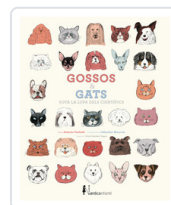
GOSSOS I GATS SOTA LA LUPA DELS CIENTIFICS FISCHETTI, ANTONIO