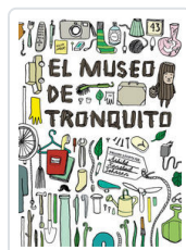
MUSEO DE TRONQUITO, EL KANSTAD, ASHILD