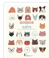
GOSSOS I GATS SOTA LA LUPA DELS CIENTIFICS FISCHETTI, ANTONIO