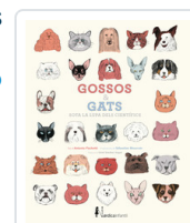
GOSSOS I GATS SOTA LA LUPA DELS CIENTIFICS FISCHETTI, ANTONIO