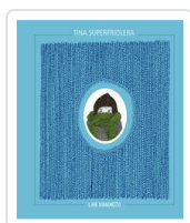
TINA SUPERFRIOLERA YAMAMOTO, LANÍ