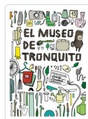
MUSEO DE TRONQUITO, EL KANSTAD, ASHILD