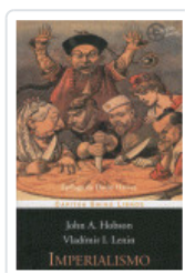
IMPERIALISMO HOBSON, JOHN