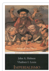
IMPERIALISMO HOBSON, JOHN