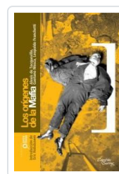
ORIGENES DE LA MAFIA DE TOCQUEVILLE, ALEXIS