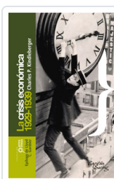
CRISIS ECONOMICA 1929-1939 KINDLEBERGER, CHARLES