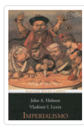
IMPERIALISMO HOBSON, JOHN