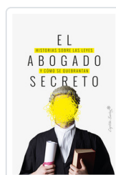
ABOGADO SECRETO, EL AA.VV.