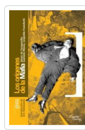
ORIGENES DE LA MAFIA DE TOCQUEVILLE, ALEXIS