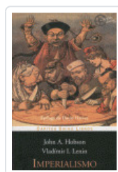
IMPERIALISMO HOBSON, JOHN