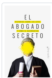
ABOGADO SECRETO, EL AA.VV.