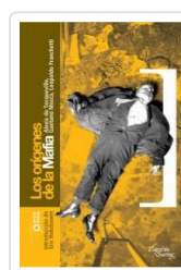
ORIGENES DE LA MAFIA DE TOCQUEVILLE, ALEXIS