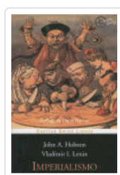
IMPERIALISMO HOBSON, JOHN