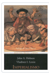
IMPERIALISMO HOBSON, JOHN