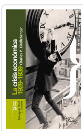
CRISIS ECONOMICA 1929-1939 KINDLEBERGER, CHARLES