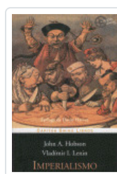
IMPERIALISMO HOBSON, JOHN