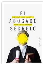
ABOGADO SECRETO, EL AA.VV.