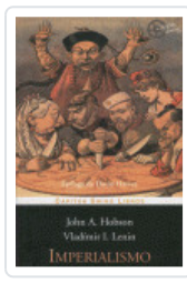
IMPERIALISMO HOBSON, JOHN