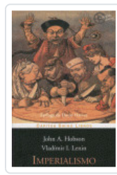
IMPERIALISMO HOBSON, JOHN