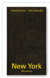
NEW YORK MEMORIES JIMENEZ/ COLACELLO