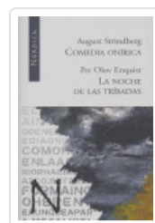
COMEDIA ONIRICA / NOCHE TRIBADAS STRINDBERG, AUGUST