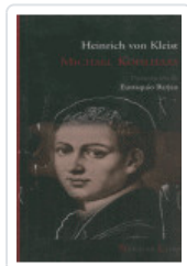
MICHAEL KOHLHAAS VON KLEIST, HEINRICH