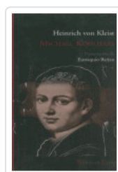
MICHAEL KOHLHAAS VON KLEIST, HEINRICH