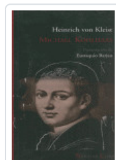
MICHAEL KOHLHAAS VON KLEIST, HEINRICH