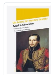
UN HEROE DE NUESTRO TIEMPO LERMONTOV, MIJAIL