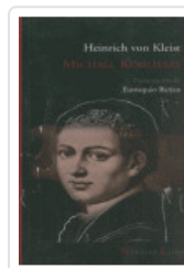
MICHAEL KOHLHAAS VON KLEIST, HEINRICH