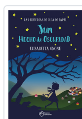
JUM HECHO DE OSCURIDAD GNONE, ELISABETTA