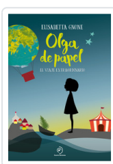
OLGA DE PAPEL GNONE, ELISABETTA