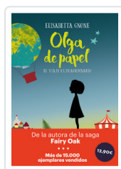
OLGA DE PAPEL - OFERTA- GNONE, ELISABETTA