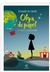
OLGA DE PAPEL GNONE, ELISABETTA