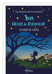
JUM HECHO DE OSCURIDAD GNONE, ELISABETTA