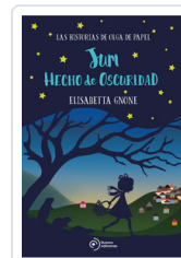
JUM HECHO DE OSCURIDAD GNONE, ELISABETTA