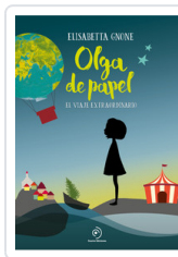
OLGA DE PAPEL GNONE, ELISABETTA