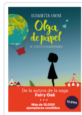
OLGA DE PAPEL - OFERTA- GNONE, ELISABETTA