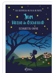
JUM HECHO DE OSCURIDAD GNONE, ELISABETTA