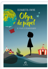
OLGA DE PAPEL GNONE, ELISABETTA