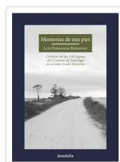
MEMORIAS DE MIS PIES REDONDO, LUIS