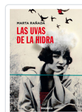
UVAS DE LA HIDRA, LAS RAÑADA, MARTA