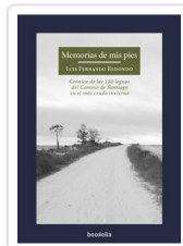
MEMORIAS DE MIS PIES REDONDO, LUIS