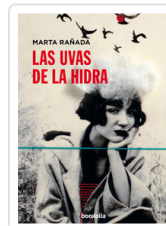
UVAS DE LA HIDRA, LAS RAÑADA, MARTA