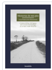
MEMORIAS DE MIS PIES REDONDO, LUIS