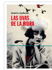
UVAS DE LA HIDRA, LAS RABADA, MARTA